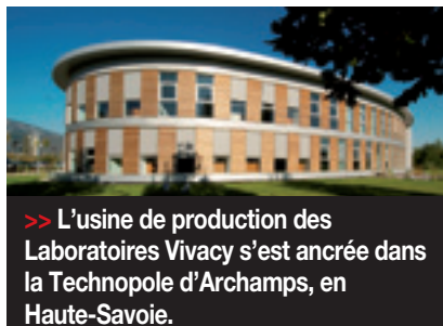
>> L'usine de production des Laboratoires Vivacy s'est ancrée dans la Technopole d'Archamps, en Haute-Savoie.

L'esthétique dans le monde affiche une croissance annuelle de 5 à 10% et si le marché s'est un peu tassé sur l'Europe de l'Ouest, en France notam-